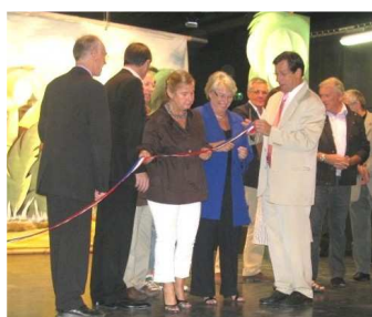
Inauguration du théâtre de Chauvé 3 octobre 2009