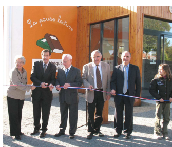
Inauguration de la bibliothèque de Vue 17 octobre 2009