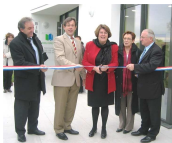
Inauguration de l'espace commun bibliothèque - maison médicale à Paulx 21 novembre 2009

Parallèlement, la pression exercée par les élus du Pays de Retz sur le Département de Loire Atlantique l'a amené à lancer une nouvelle étude de trafic en intégrant une projection sur les 15 années à venir avec des premières conclusions au premier trimestre 2010.