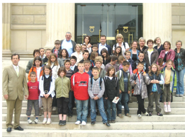
Accueil des élèves de l'école Ste Thérèse de St Hilaire de Chaléons à l'Assemblée Nationale le 27 mai dernier