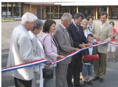
Inauguration du Groupe Scolaire Jacques Brel à St Père en Retz le 12 septembre 2009